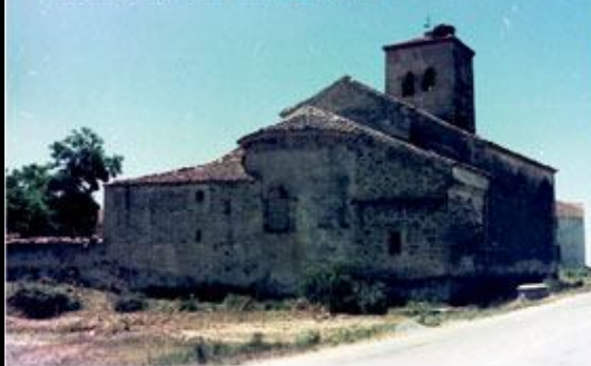
Torrecaballeros: Final 2ª Etapa