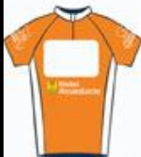
1º METAS VOLANTES